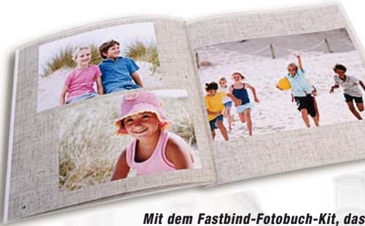
Mit dem Fastbind-Fotobuch-Kit, das es optional zum D502 gibt, lassen sich individuelle Fotobücher mit Softcover-Einband bis 15x15/ 20x20 cm, Fotobücher mit standardisiertem Hardcover bis A4 leicht und schnell selbst herstellen.

Durch die Eigenfertigung beidseitig bedruckter Seiten und die einfache Buchmontage fällt es dem Fotohändler leicht, professionelle Fotobücher selbst herzustellen. Das gilt für individuelle Fotobücher ebenso wie für standardisierte. Darüber hinaus kann der Fotohändler auf Wunsch des Kunden eine Vielzahl weiterer Bildsonderprodukte „sofort“ beziehungsweise „kurzfristig“ herstellen. Und zwar ohne Weitergabe an einen anderen Spezialisten oder Dienstleister. Der D502 und das Geräte-Set zur Fotobuchherstellung werden etwa ab Ende August 2009 lieferbar sein.