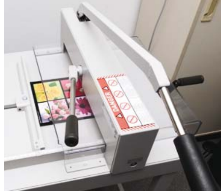
Ohne Kraftanstrengung: Mit dem Stapelschneider Ideal 4205 wird das fertig montierte Fotobuch aufs Endmaß gebracht.

Die drei Geräte sind solide und kinderleicht zu bedienen. Zum Kit gehört zudem eine Grundausstattung Verarbeitungsmaterial. Schon nach kurzer Zeit ist es möglich, mit ihnen zügig hochwertige Fotobücher in guter buchbinderischer Qualität herzustellen. So schnell, daß Kunden auf die Fertigstellung eines oder weniger Bücher warten können. Obendrein zeichnet sich das Geräte-Trio durch einen günstigen Anschaffungspreis aus.