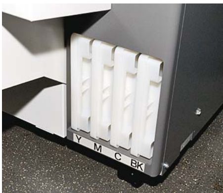
Leicht von vorn erreichbar und selbst während eines laufenden Druckauftrages zu wechseln: die 4 Tintenkartuschen (r.) mit je 500 ml Dye-Tinte.