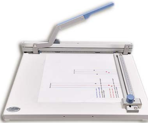
Rillen mit dem Fastbind Creaser C33: Mit Schablone versehen, lassen sich Standard-einstellungen jederzeit leicht reproduzieren. Millimetergenaue individuelle Einstellungen sind ebenfalls möglich.