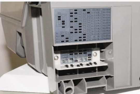
Nimmt das Papier ausschließlich als Blattware auf: das Papiermagazin des D502. Durch die Codierung (u.) erkennt das Gerät, welches Papier sich im Magazin befindet. Noritsu liefert den D502 mit drei Papiermagazinen.